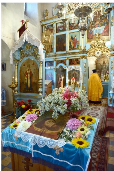
Великолепное убранство церкви «Всех скорбящих Радость»