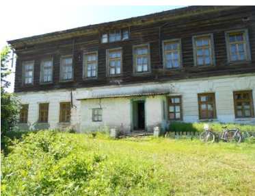
Дом помещика Кутлубицкого – сельская больница