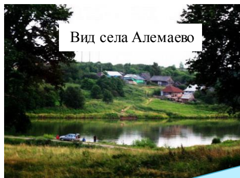
Вид села Аламаево

Откуда в народной легенде появилось имя Илья – неизвестно.