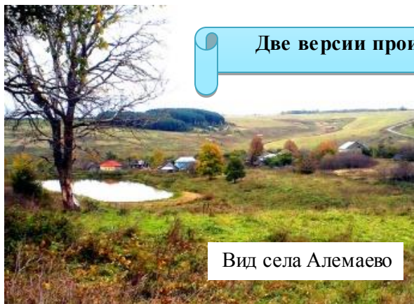
Вид села Аламаево