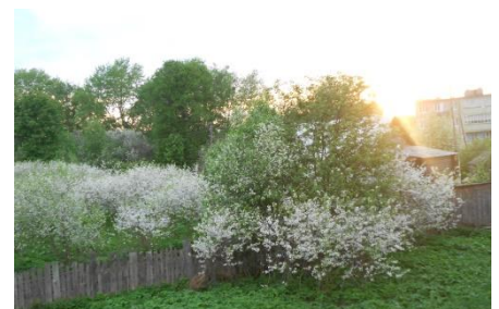
Цветущий вишневый сад

Больница (дом Кутлубицкого) стала главной достопримечательностью села. В настоящее время здесь находится сельская врачебная амбулатория.