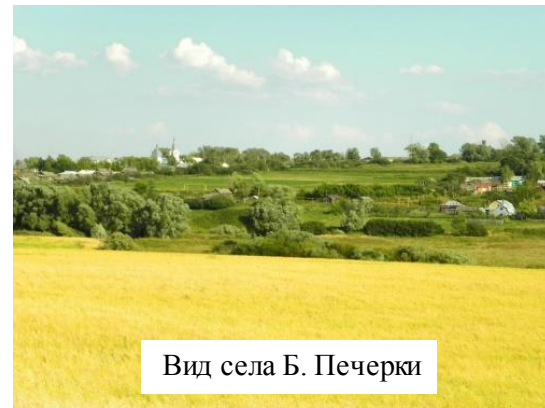
Вид села Б. Печерки

Село Большие Печёрки построено около 400 лет назад, после принятия Соборного Уложения 1649 года (крестьяне бежали на окраины страны, а Нижегородская земля была в то время была северной границей). Существует две версии происхождения термина «Печерки». Первая связана с местом жилья сельчан, жили в землянках, «пещерах». Вторая версия говорит, что в переводе «Печерки» означают «сосновый бор». Первые селения появились в лесу, близ озера Сосны. Село было разделено на 2 части. Первая часть принадлежала помещику Дику, а вторая Шелеметьева барщина (крестьяне работали на помещика Шереметьева вместе с жителями села Нагаево).