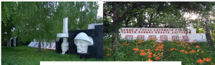
Памятник воинам, павшим в годы Великой Отечественной войны

Ученики Смирновской школы следят за состоянием памятного места, сажают цветы и деревья.