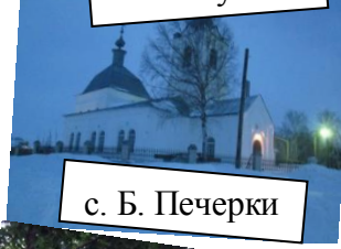
с. Б. Печерки