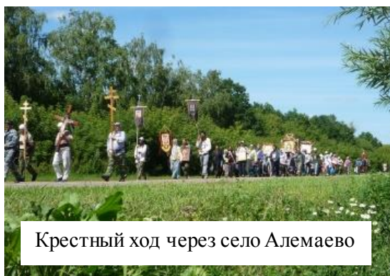
Крестный ход через село Аламаево