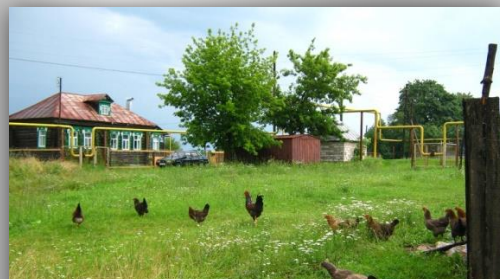
Улица Гагарина (в народе – Запиралиха)

Каждый смирновец вправе придерживаться своей версии.