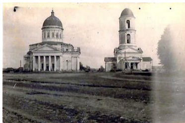
Так выглядела церковь в с. Костянка

И даже 10-15 лет назад владельцы садов спешили на свои участки, собирали вишню, продавали её, а на вырученные деньги одевали и обували детей к школе, покупали различную бытовую технику и многое другое. Всё зависело от урожая.