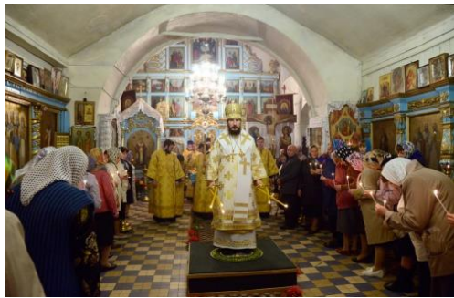
Служба в церкви на светлый праздник Пасхи