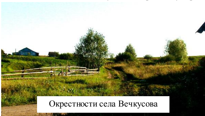
Окрестности села Вечкусова

Местоположение села Вечкусова - на речке Суморге.