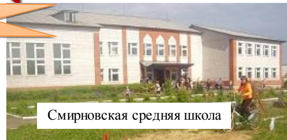
Смирновская средняя школа