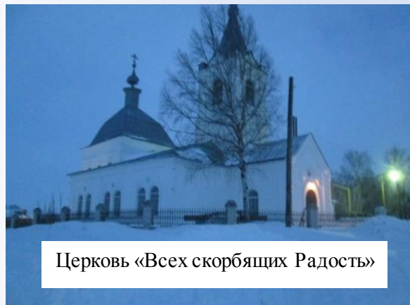
Церковь «Всех скорбящих Радость»

Церковь никогда не закрывалась с момента возникновения. Даже в 30-60-ые годы ее не закрывали, несмотря на то, что несколько раз представители власти приезжали, чтобы снять колокола. Жители села по очереди дежурили день и ночь у храма. Как только приезжали власти, дежурные звонили в колокола и сельчане прибежали, чтобы отвоевать церковь. Одну женщину за сопротивление власти арестовали, больше ее никто не видел. В 1960 году храм горел по причине печного отопления. Тушили храм всем миром и восстанавливали на средства прихожан. В настоящее время служба в храме идет регулярно.